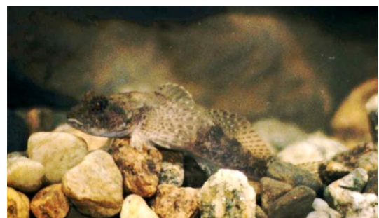
Hvitfinnet steinulke finnes i Norge bare i Haldenvassdraget og Store Le (og Rømsjøen?).

Fiskefaunaen i Haldenvassdraget er relativt godt kartlagt takket være undersøkelser som er gjort bl.a. av Fylkesmannen i Østfold/fiskeforvalteren, Haldenvassdragets Vassdragsforbund og Haldenvassdragets Brukseierforening/Utmarksavdelingen Akershus-Østfold, og det drives nå overvåkning av fiskebestandene ved periodevise undersøkelser. I Marker er det foretatt en mer nøyaktig kartlegging av artssammensetningen i alle innsjøene i kommunen i regi av Kanalmuseet, og resultatene er nylig publisert :