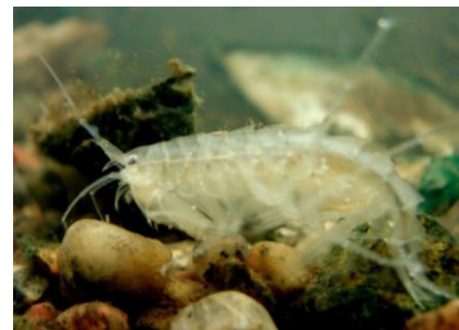
Trollistidskreps (3 cm) -vanlig i Haldenvassdraget, men meget sjelden i Norge.

Dette er en gruppe på 7 arter som har en meget spesiell utbredelse i verdenssammenheng. De ble spredt i ferskvannssjøer i kanten av isbreen i slutten av siste istid, og finnes i Skandinavia, Finland og Russland. Noen av artene forekommer også i Nord-Amerika. I Norge har vi 6 av disse artene, som hos oss stort sett forekommer på Østlandet. Alle artene forekommer i Haldenvassdraget, som eneste vassdrag i Norge. Dette medfører et spesielt ansvar når det gjelder forvaltning. Denne meget interessante gruppen, der flere av artene er rødlistet, er bare i liten grad blitt undersøkt i Haldenvassdraget, men Kanalmuseet har startet en kartlegging som vil bli videreført i 2008. Disse artene bør absolutt følges opp i den videre overvåking av vassdraget.