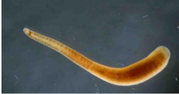
Liten hundeigle – ny art for Norge.

Vannsnegl er relativt godt undersøkt, først av Økland på 50- og 60-tallet og seinere av Spikkeland i løpet av de siste årene. Det er påvist 23 av ca. 30 norske arter i vassdraget, og dette gjør vassdraget til det mest artsrike i Norge. To av fire norske rødlistearter er påvist. Glomma når muligens opp til et tilsvarende artsantall, men dette vassdraget har et nedbørfelt som er 25 ganger så stort, og inneholder også innførte arter. I Øymarksjøen er det funnet 17 arter, noe som gjør denne innsjøen til den suverent mest artsrike sneglelokaliteten i Norge!