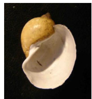
Den sjeldne øresneglen finnes i Haldenvassdraget.

Vassdraget har en meget rik fuglefauna. Spesielt må framheves de artsrike fuglesjøene Gjølssjø, Hellsjøvann og Hemnessjøen, men i tillegg kommer de store innsjøene hvor også andre arter finnes. Det er registrert omkring 14 rødlistede vannfuglarter som hekker i vassdraget. Av arter som er tilknyttet de store innsjøene og som er avhengig av relativt rent vann kan nevnes fiskeørn (NT) og storlom (VU). I 2007 gjennomførte Kanalmuseet en kartlegging av fuglebestandene i Øymarksjøen, og dette arbeidet fortsetter i 2008. Omkring 25 arter av vannfugl hekker ved innsjøen, noe som er et høyt tall.